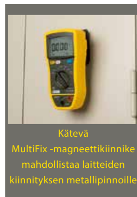
Kätevä MultiFix -magneettikiinnike mahdollistaa laitteiden kiinnityksen metallipinnoille