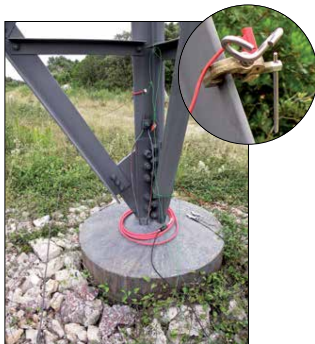
Mittausten suorittaminen kaikille mastotyypeille sekä tuulivoimaloille onnistuu AmpFLEX-virtapihtien avulla.

Joustavat AmpFLEX™ -lenkkivirtapihdit: Valittavana useita eri pituuksia ja tyyppisiä, alk. Ø 140 mm